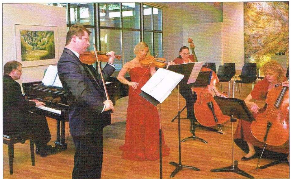
Odeon orchestra se produira dimanche à 11 h à l'église de Garnison.

En clôture de ce premier week-end du festival Compli'Cité, un très beau moment de théâtre